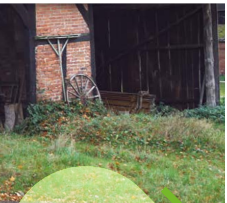
Bei diesem historischen Schafstall wurde das Dach mit Faserzementplatten gedeckt. Bei der Sanierung erhielt er wieder ein Reetdach.