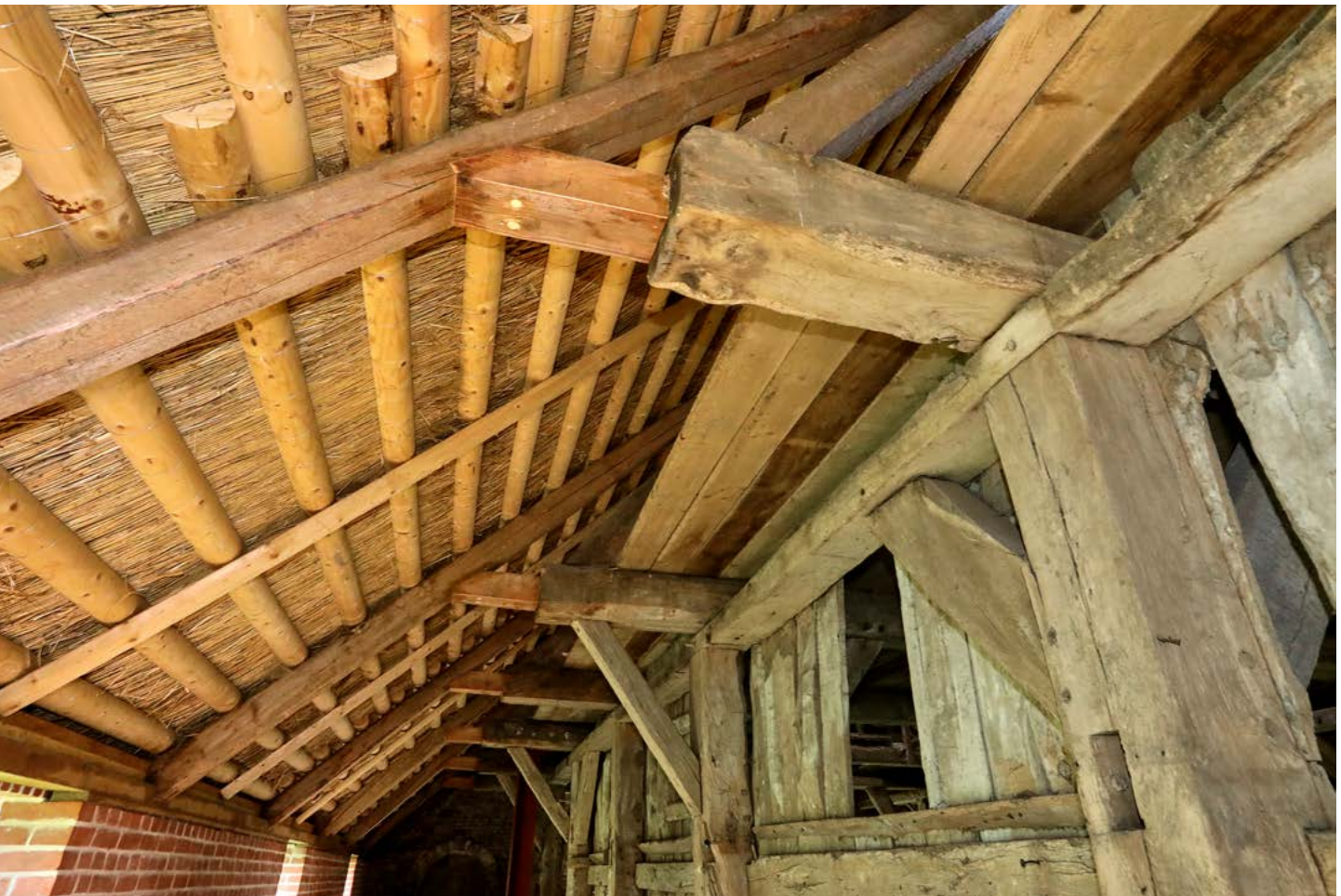
Mit natürlichen und zum Denkmal passenden Materialien – Holz und Reet – wurde das Dach dieser Scheune neu gedeckt.