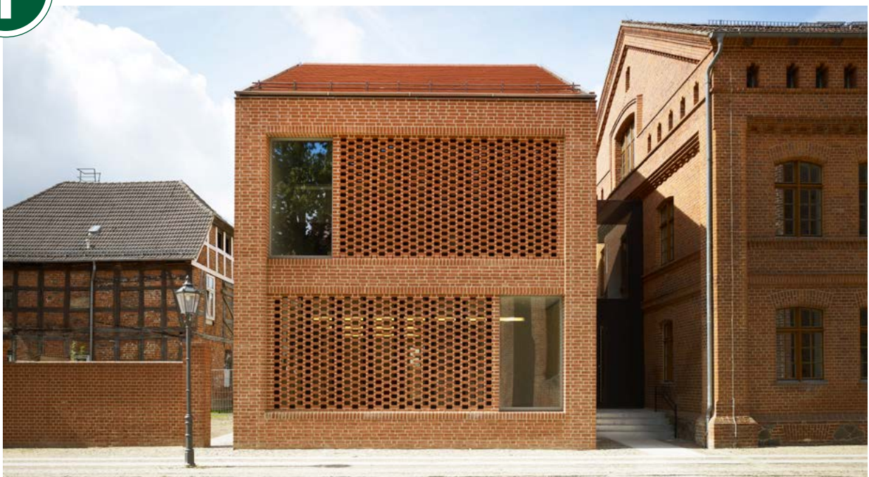
Erweiterung der denkmalgeschützten Schulgebäude aus der Gründerzeit um einen Neubau aus Backstein, der sich harmonisch in die bestehende Substanz einfügt.