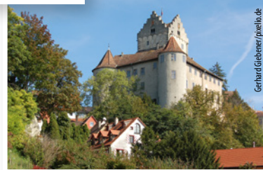
Altes Schloss Meersburg

Alle Denkmale, denen wir in Ulm bereits helfen konnten, finden Sie hier: www.denkmalschutz.de/denkmale-ulg