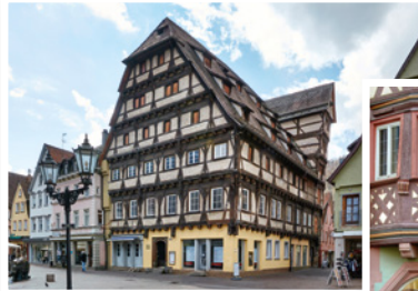
Alter Zoll Geislingen