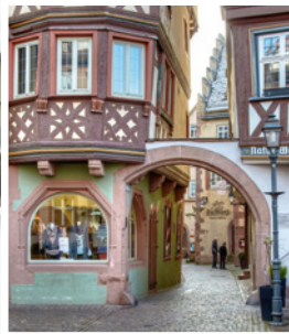
Alte Münz Wertheim