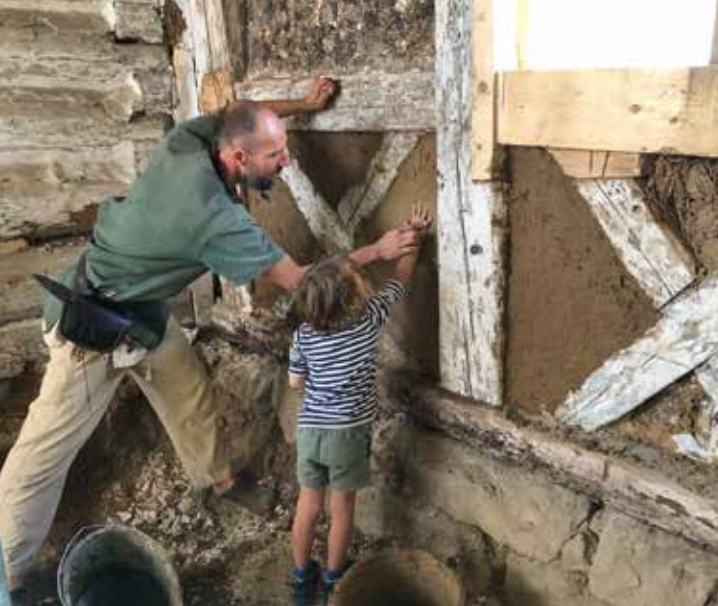
Denkmalschutz ist Programm – auch für die Jüngsten

Begeistert vom Tag des offenen Denkmals®? Dann spenden Sie für den Erhalt unserer Denkmallandschaft!