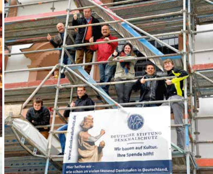
Ganz nah dran an Denkmalen