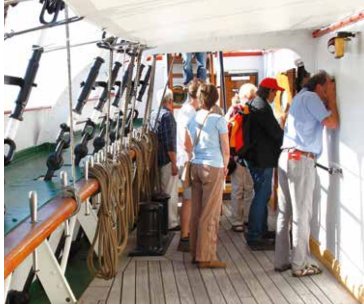
Spannende Einblicke beim Tag des offenen Denkmals

Ein Tag voller unvergesslicher Erlebnisse: Besuchen Sie den Tag des offenen Denkmals®!