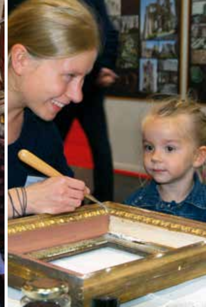
Unvergessliche Erlebnisse für Klein und Groß – vor Ort oder digital