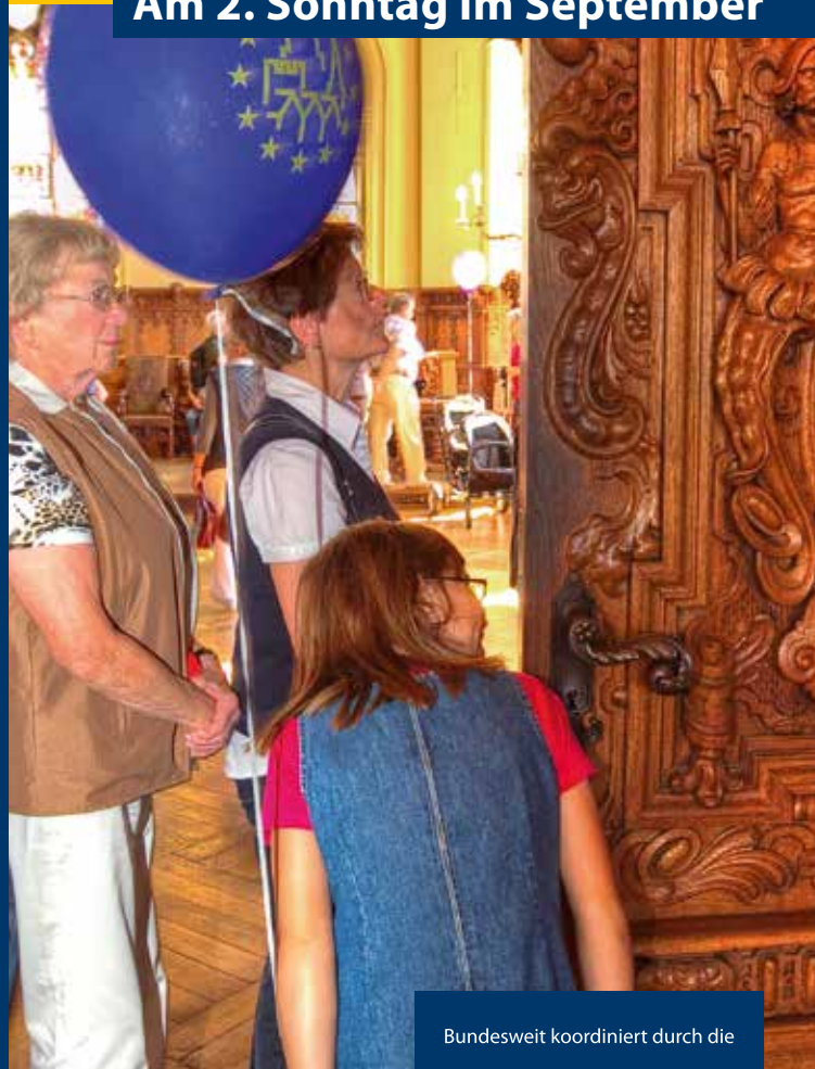
Stand: April 2022