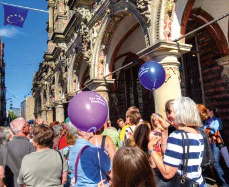
Am Tag des offenen Denkmals Geschichte erfahren