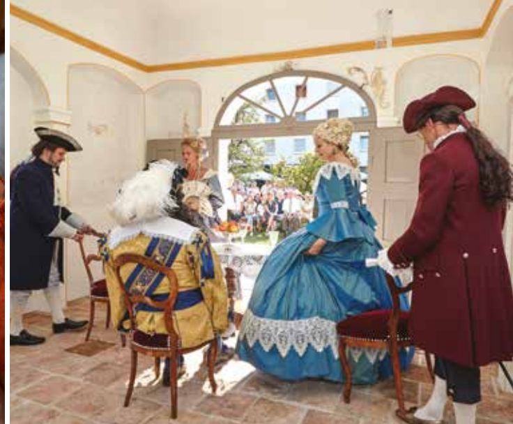
Für einen Tag zurück in die Vergangenheit