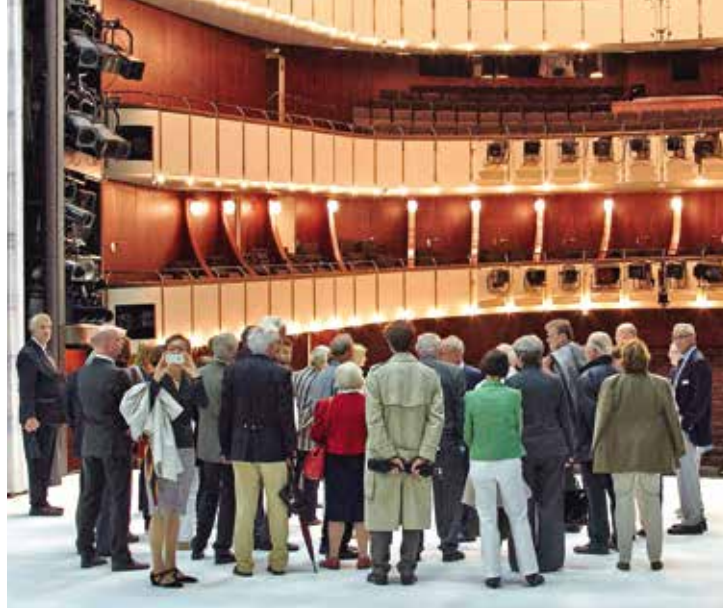
Große Bühne für den Denkmalschutz